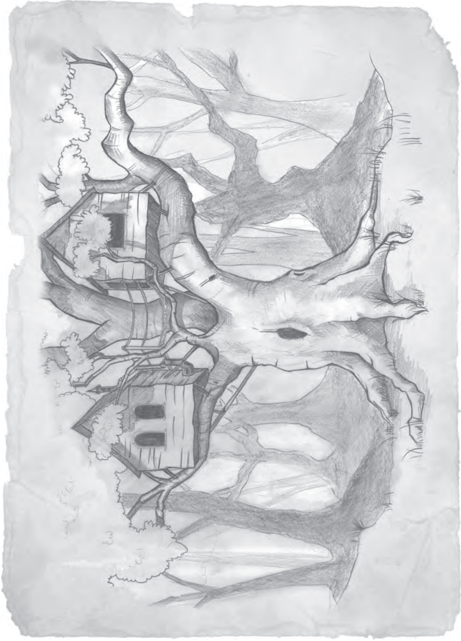
»Pitov grad« iz skicirke Kalmarja Wingfeatherja